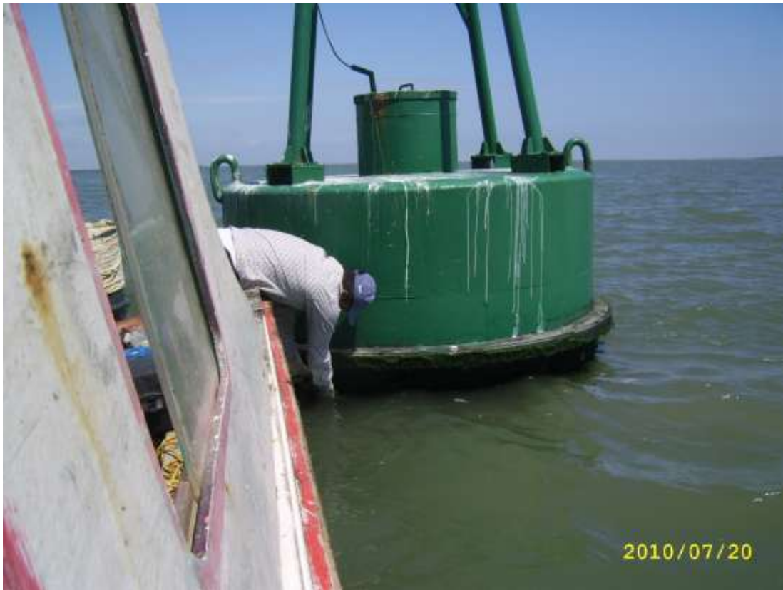
Fotografía 2. Proceso de recolección de muestras de bivalvos de la Boya No. 59