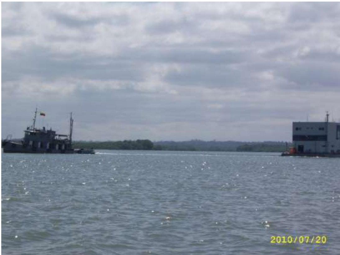
Fotografía 3. Remolcador de la Armada Nacional halando una plataforma flotante del Sistema de Seguridad Marítima, por el sector de dragado entre Boyas 51 a 54.