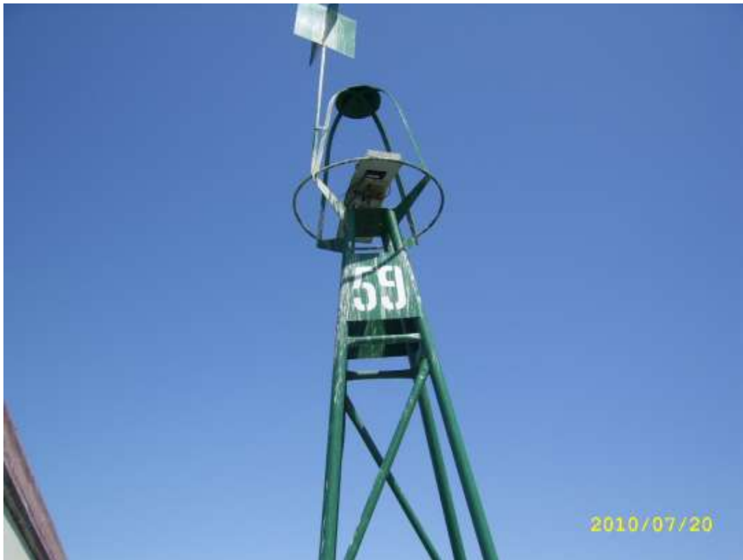
Fotografía 1. Aspecto de la Boya No. 59, que es una de las estaciones para el muestreo de bivalvos en el Canal de Acceso al Puerto Marítimo de Guayaquil