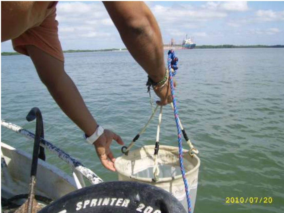
Fotografía 5. Aparejos para el proceso de arrastre para el monitoreo del componente biótico en sector de la Boya 66 del Canal de Acceso al Puerto Marítimo de Guayaquil.