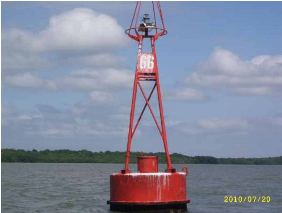
Fotografía 4. Aspecto de la Boya No. 66, que es una de las estaciones de monitoreo ambiental del Dragado del Canal de Acceso al Puerto Marítimo de Guayaquil.