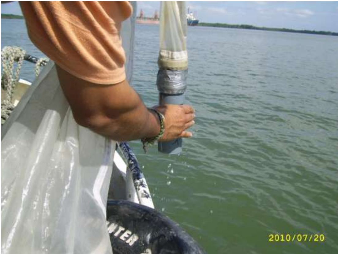
Fotografía 6. Recolección de zooplancton en sector de la Boya 66 del Canal de Acceso al Puerto Marítimo de Guayaquil.