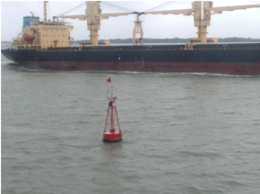
Fotografía 4. Paso de buque mercante por el sector de boya 46 en la zona de dragado de mantenimiento del Canal de Acceso al Puerto Marítimo de Guayaquil.