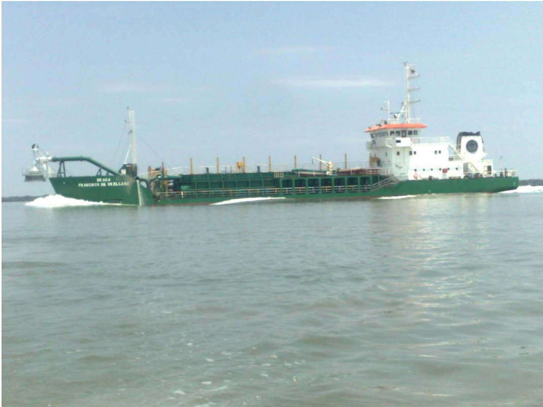
Fotografía 3. Draga Francisco de Orellana, con tolva llena, dirigiéndose al sitio de depósito de sedimentos, luego de dragado de mantenimiento en sector de Boyas 44 a 48.