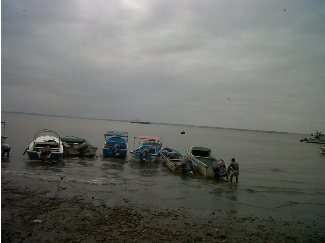
Fotografía 1. Vista general del sector de embarque en Posorja, de las lanchas logísticas que transportan el personal, víveres y vituallas hasta la draga DRAFOR