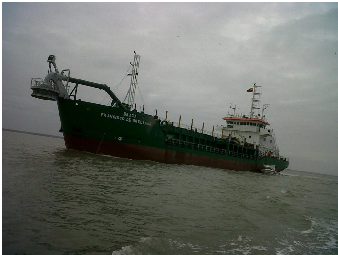
Fotografía 2. Dragadora Francisco de Orellana (DRAFOR), con tolva vacía, en maniobra de recepción de personal desde lancha de apoyo en sector de Boyas 44 a 48.