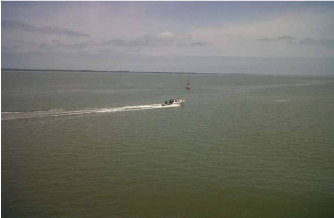
Fotografía 5. Vista de la lancha de monitoreo ambiental navegando en la zona de dragado del Canal de Acceso al Puerto Marítimo de Guayaquil.