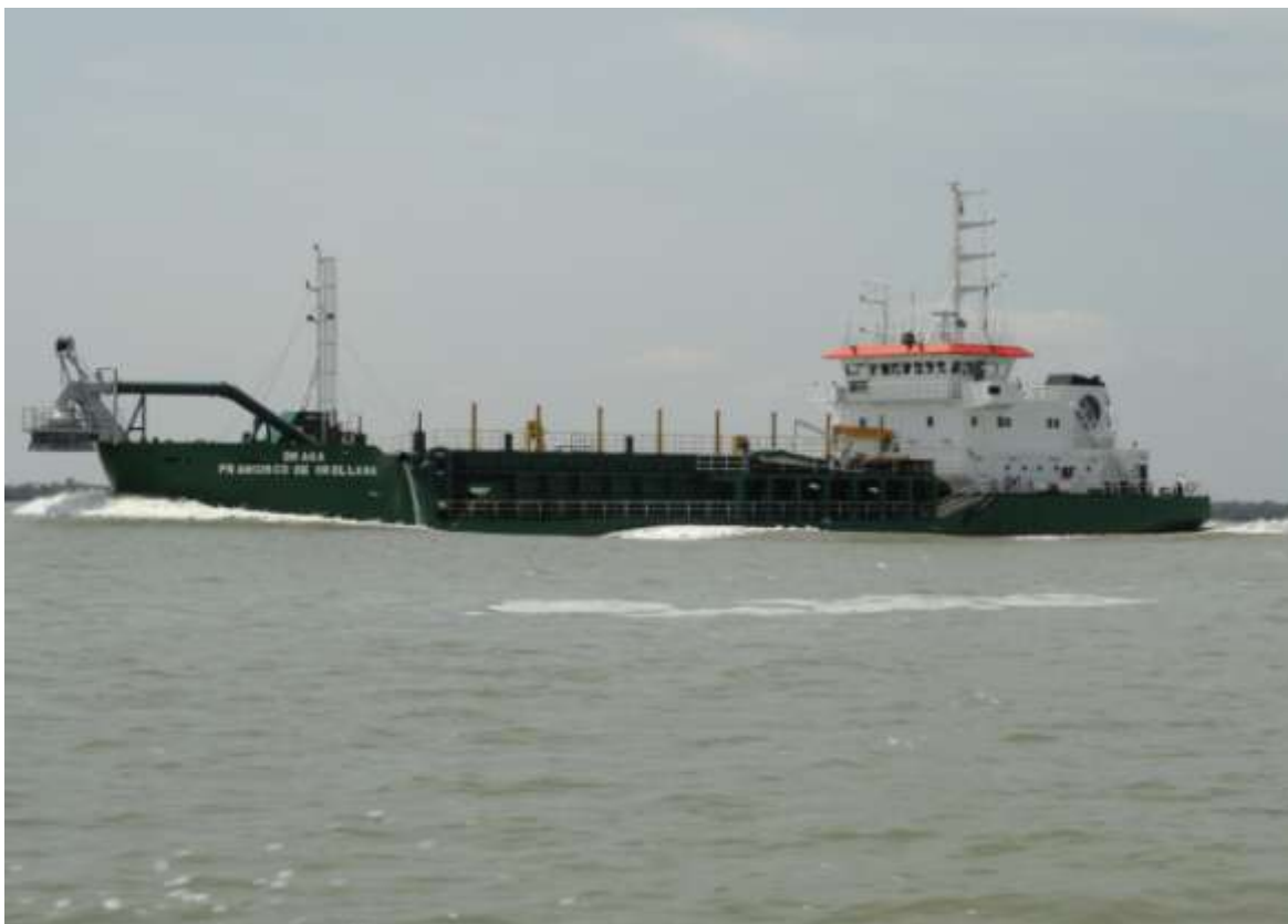
Fotografía 2. Transporte de sedimentos de DRAFOR a la zona de depósito, luego de cumplir un ciclo de dragado en el sector de Boyas 44 a 48