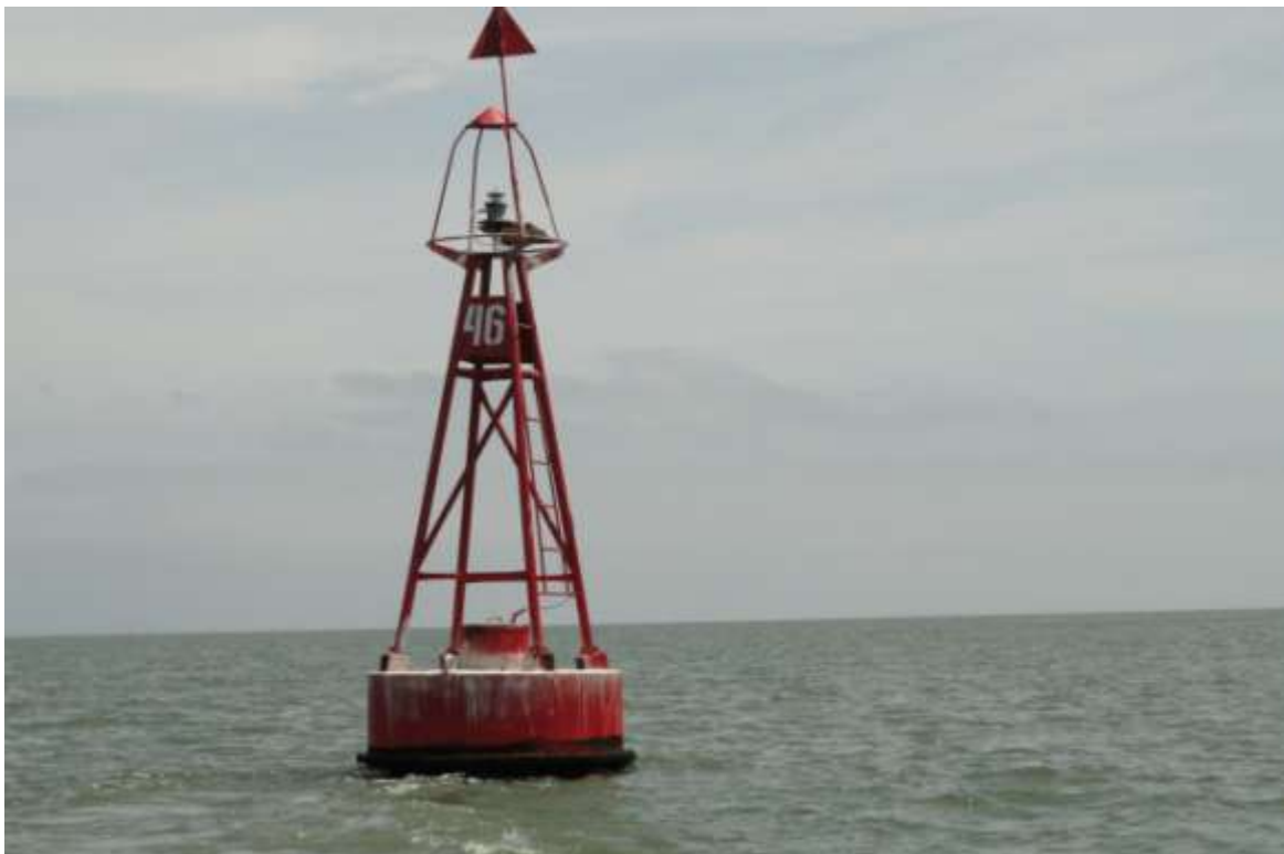
Fotografía 4. Aspecto de la Boya No. 46, durante las campañas de monitoreo ambiental del Dragado del Canal de Acceso al Puerto Marítimo de Guayaquil