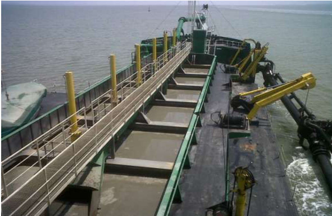
Fotografía 1. Tolvas llenas con sedimentos abordo de DRAFOR, al finalizar un ciclo de dragado en el sector de Boyas 44 a 48, canal de acceso al Puerto de Guayaquil