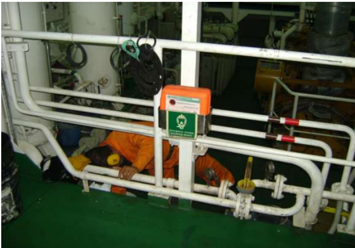
Fotografía 6. Vista de uno de los compartimentos de la Draga Francisco de Orellana, donde se observa un operador con protectores auditivos.