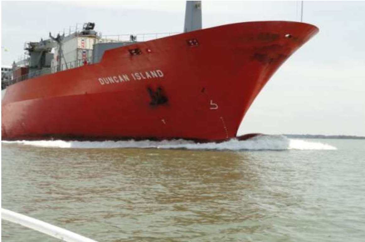
Fotografía 3. Paso del buque portacontenedor "Duncan Island", por un costado de la lancha de monitoreo diario, por el sector de dragado entre Boyas 44 a 48.