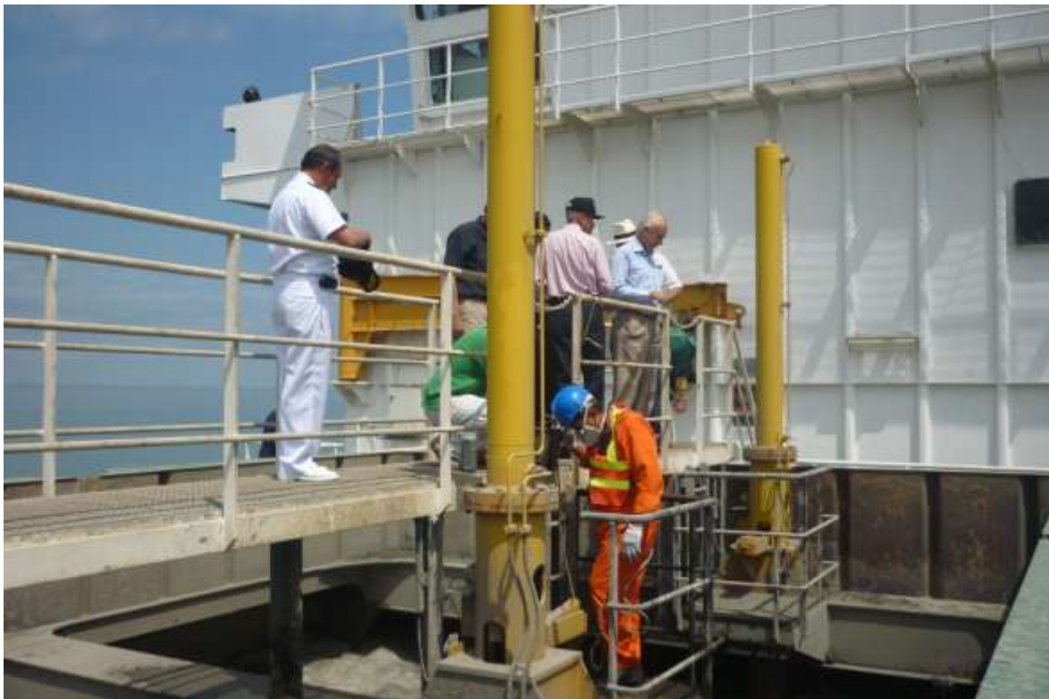
Fotografía 3. Toma de muestra de sedimentos de una de las tolvas de la draga.