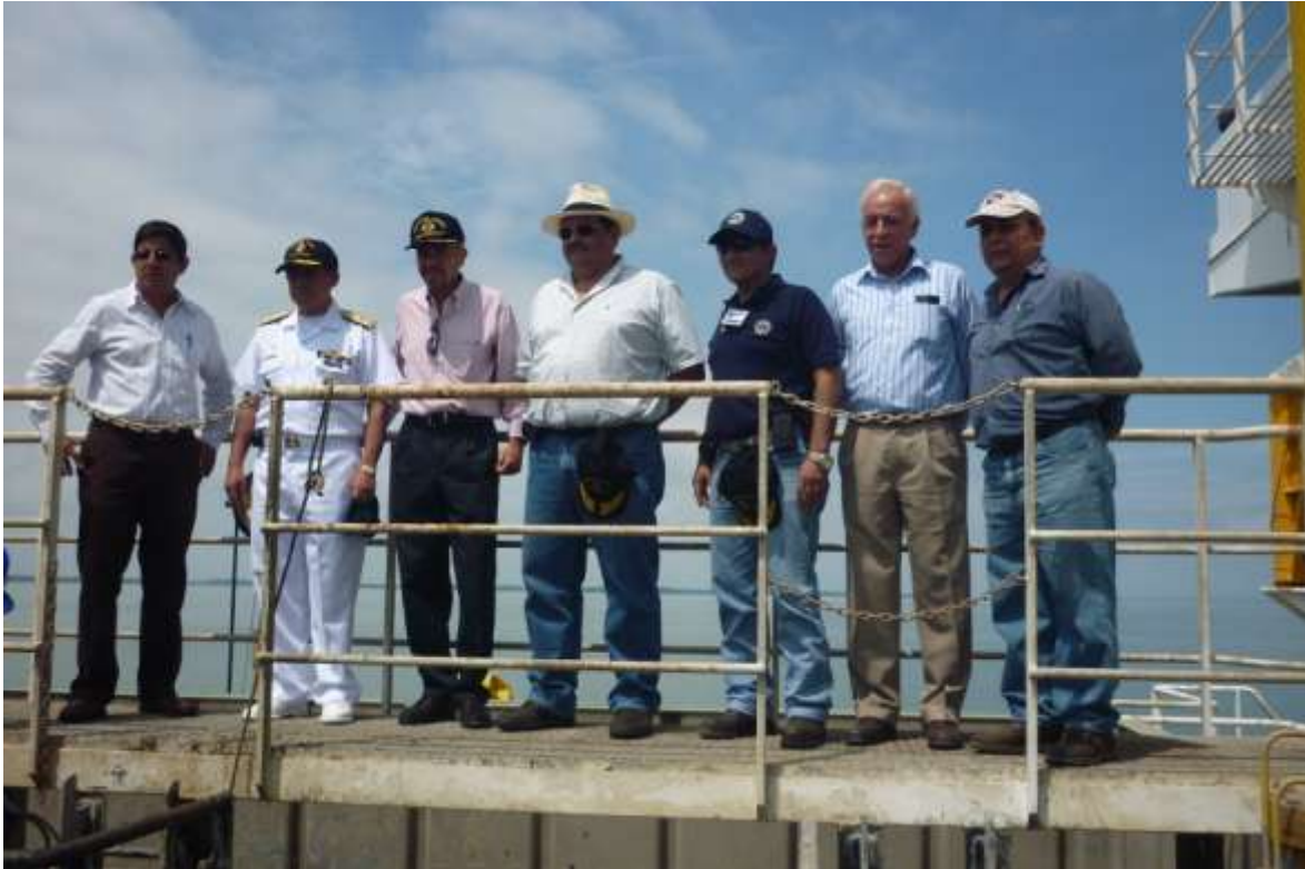
Fotografía 1. Comitativa de Autoridad Portuaria de Guayaquil, Dirección General de Intereses Marítimos, Servicio de Dragas de la Armada, Fiscalización y Auditoría Ambiental de la ESPOL, a bordo de la Draga Francisco de Orellana