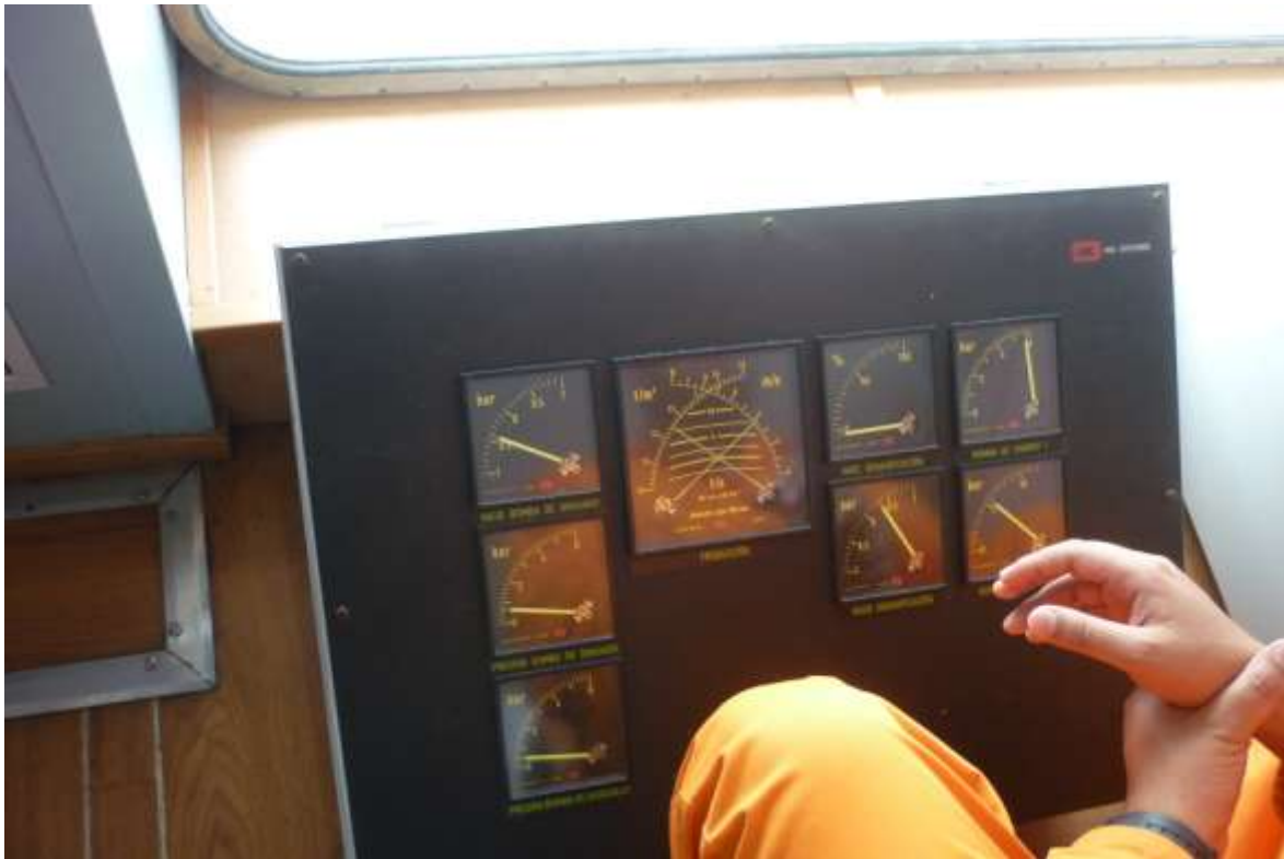
Fotografía 2. Equipo con sensores de densidad de sedimentos operando en un ciclo de dragado, sector de Boya 51, durante inspección abordo de la DRAFOR