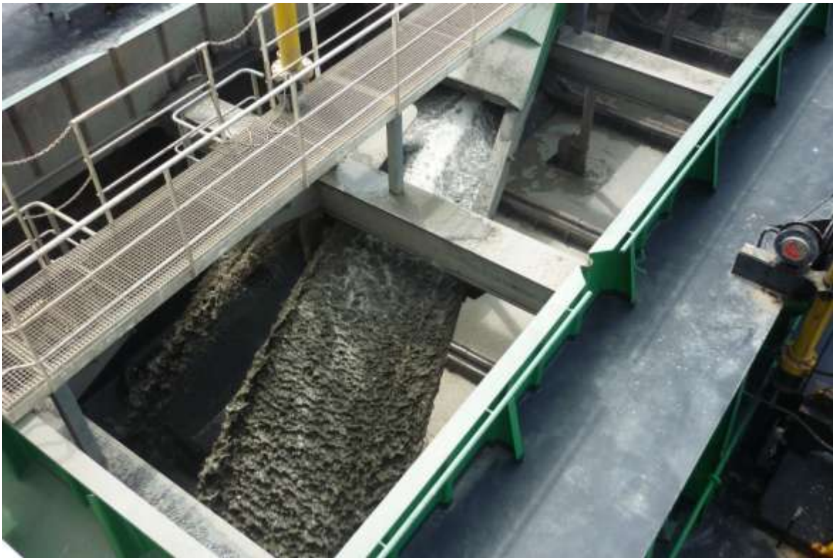
Fotografía 6. Proceso de llenado de una de las cántaras, o tolvas de la draga, supervisado por la comitiva de inspección abordo