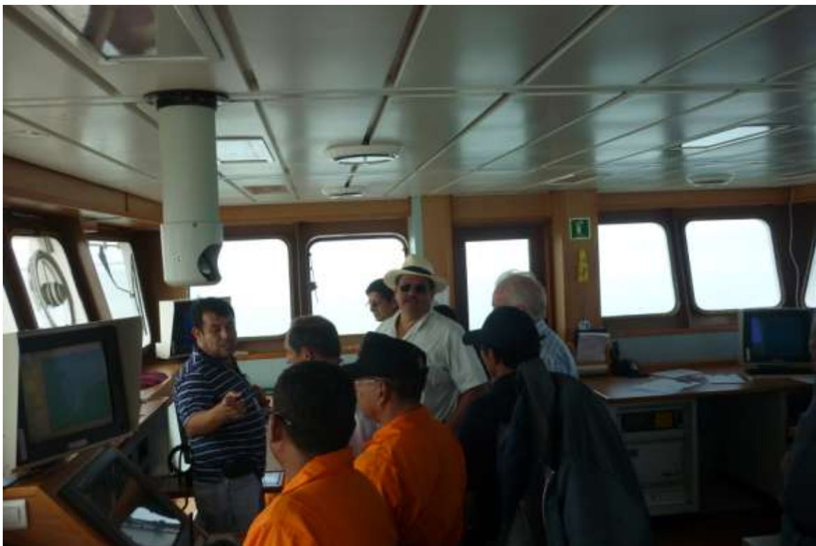
Fotografía 5. Funcionarios de APG, DIGEIM, SERDRA y ESPOL compartiendo información con el personal de la Fiscalización y Auditoría Ambiental